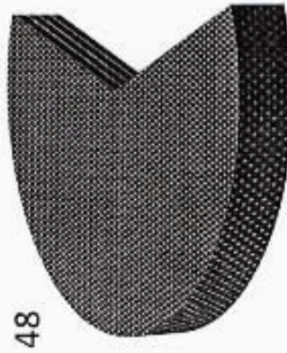
Органами государственной власти Республики Дагестан